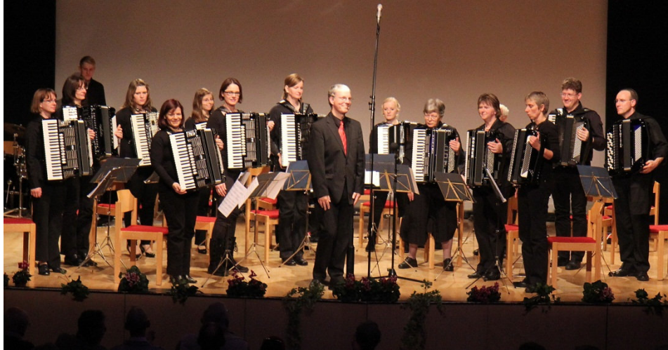
AOVechta beim Konzert im November 2012 in Berlin